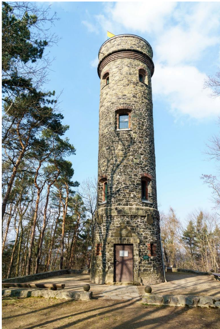
Auf dem Wachberg bei Waldheim befindet sich der mehr als 150 Jahre alte Friedensturm.