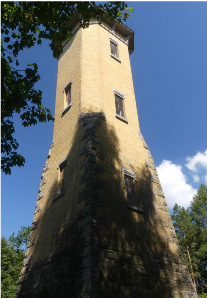
Nördlich von Treuen steht auf der Wilhelmshöhe, DA/SX-531, der Perlaser Turm. Er wurde im Jahr 1907 in Naturstein und Ziegelbauweise erbaut.