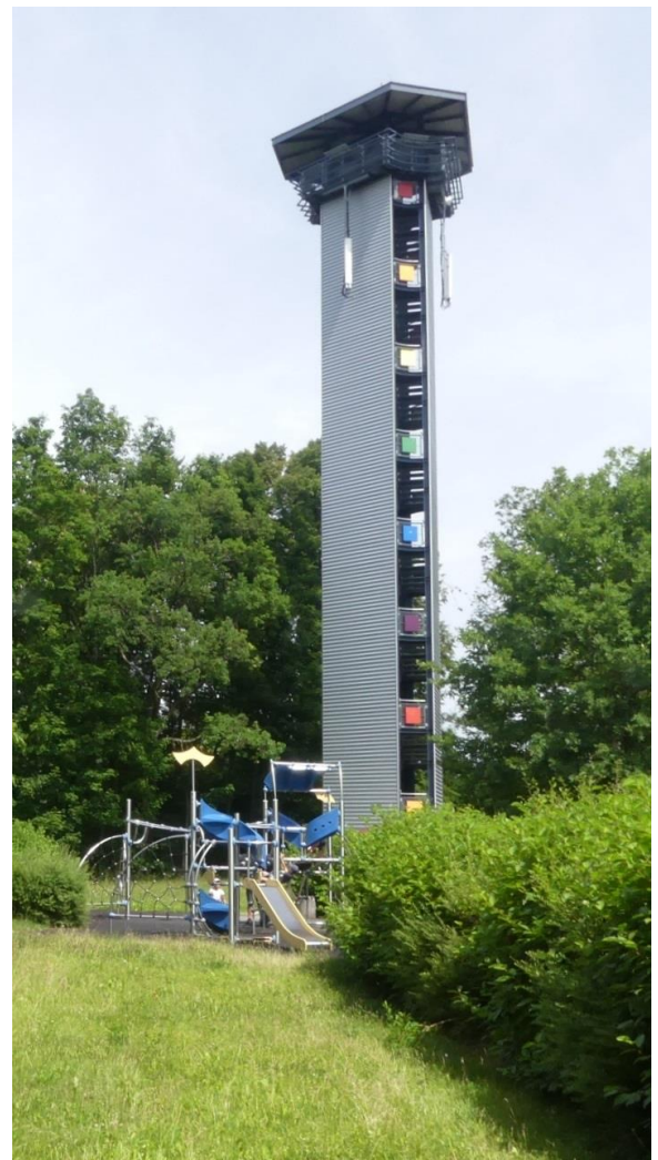
Auf dem Bühl in Eibenstock, DA/SX-442, direkt neben dem Restaurant und Hotel Bühlhaus, steht der Glückaufurm.