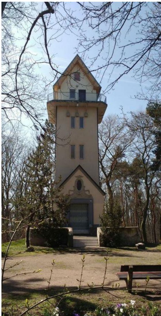
In Taucha steht auf dem Weinberg der 1995 wieder eröffnete Aussichtsturm.