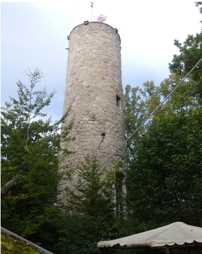
Bei Kirchberg südlich von Wilkau-Haßlau geht es auf den den Borberg, DA/SX-552 mit Turm.